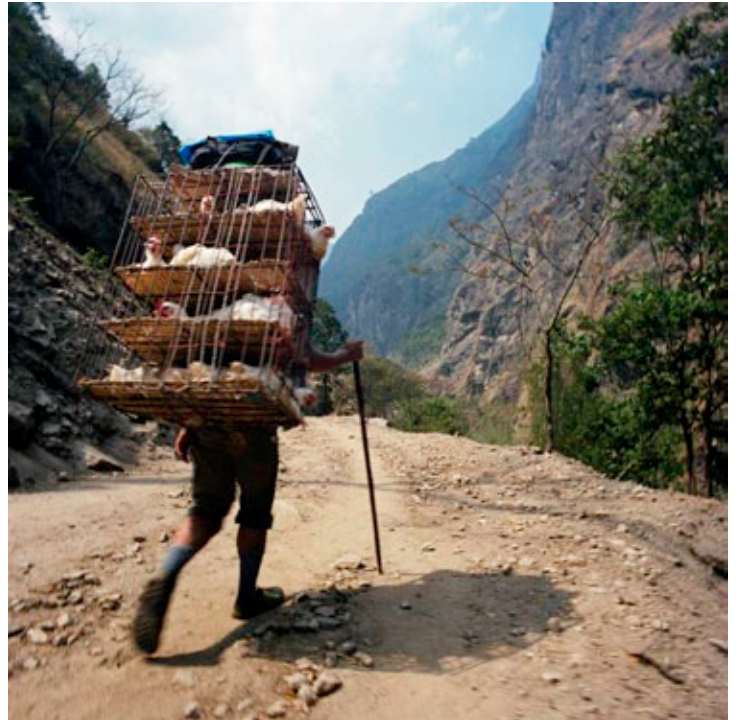
Lhakpa Pasang Sherpa - lundì 5 avril, 11h02.