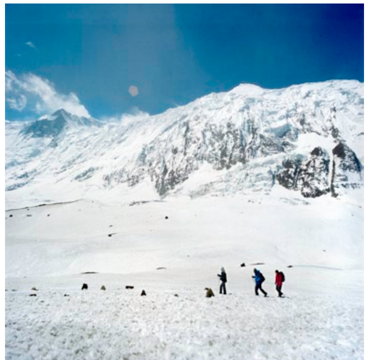
Norub Tamang - samedi 10 avril, 12h12.